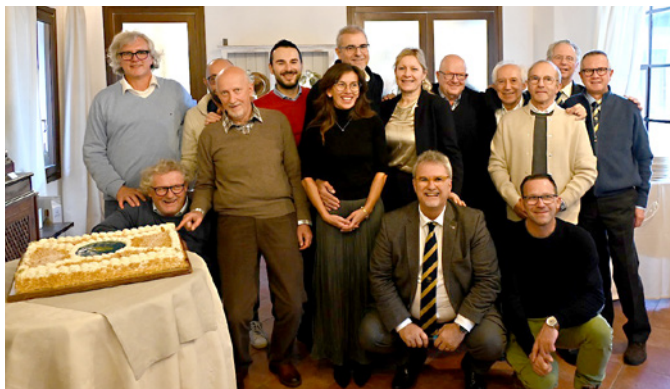
Il Direttivo del CVAE 2024

Eleganti, piacevoli, leggeri, sono da leggere perché raccontano, attraverso una storia intrisa di auto, donne e corse, gli albori del motorismo a cavallo tra la fine dell'800 e l'inizio della Belle Epoque. Nei romanzi troviamo anche riferimenti alla "Prova di Resistenza" del 1899, prima gara svolta in Veneto e terza di sempre in Italia, che il nostro Club rievoca da qualche anno con l'importante raduno a calendario nazionale ASI "Prova Resistenza Veicoli Automobili Province Venete", unica manifestazione in Italia riservata ad autoveicoli costruiti entro il 1904. Buona lettura.