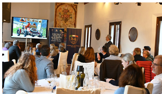
Ricordando il 2023