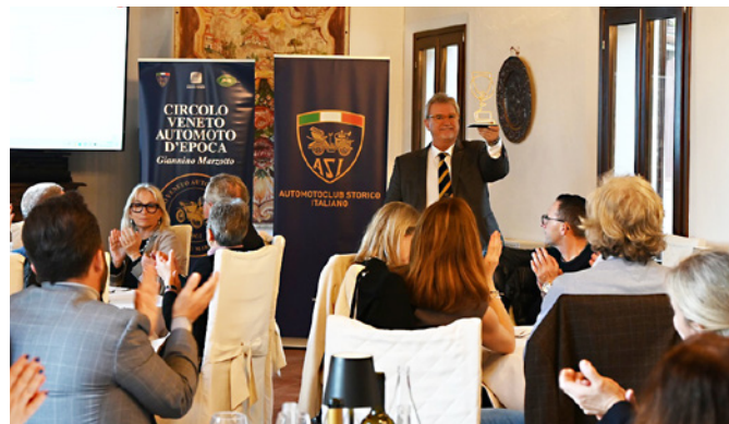
Il Premio "Best in Classic" 2023 vinto dal CVAE!